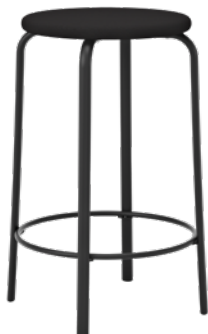
P251 L, assise en tissu P251 LT, assise en bois massif