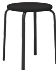
P250, assise en tissu P250 T, assise en bois massif