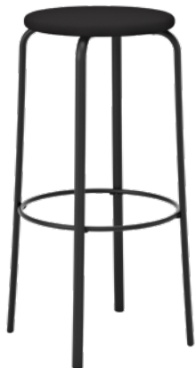
P251, assise en tissu P251 T, assise en bois massif

Les tabourets Frisbee sont disponibles dans les hauteurs suivantes : 460, 640 et 790 mm.