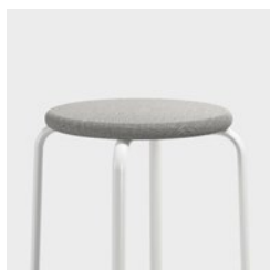
ASSISE EN TISSU